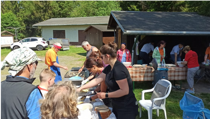
Gut wird gespeist an Pfingstmontag auf dem Knüllfeld....

Im Wonnemonat Mai wird in unserem Tal viel gefeiert, neben den ganz gewöhnlichen Gottesdiensten und regelmäßigen Veranstaltungen wurde auch oft und viel gegessen: gute Verpflegung auf der Meilerstätte am Himmelfahrtstag, Kaffee und Kuchen zum Seniorennachmittag in der Mehrzweckhalle in Viernau und nicht zu vergessen Pfingstmontag auf dem Knüllfeld, wo es wieder Eier und Speck, vom Posaunenchor zubereitet, gab. Man möchte fast sagen, im Haseltal geht Gottes Liebe auch durch den Magen.