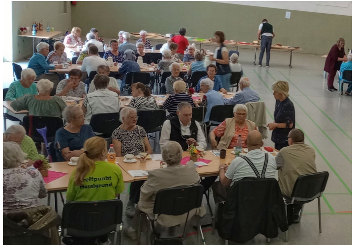
...und zum Seniorennachmittag.