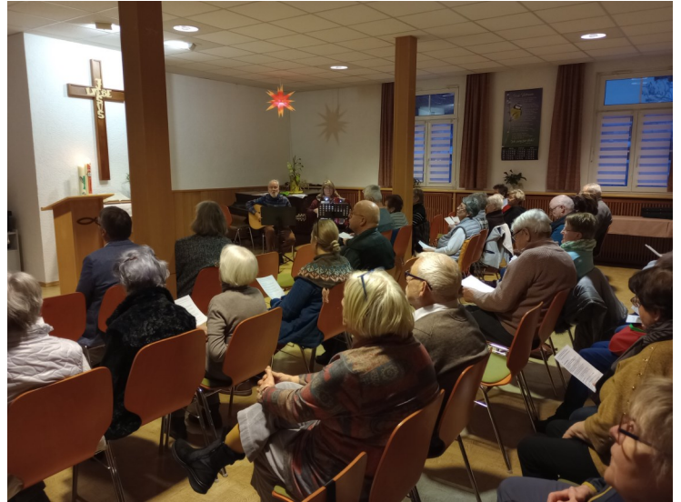
Der gut besuchte Abschlussgottesdienst der Allianzgebetswoche in den Räumen der Landeskirchlichen Gemeinschaft.